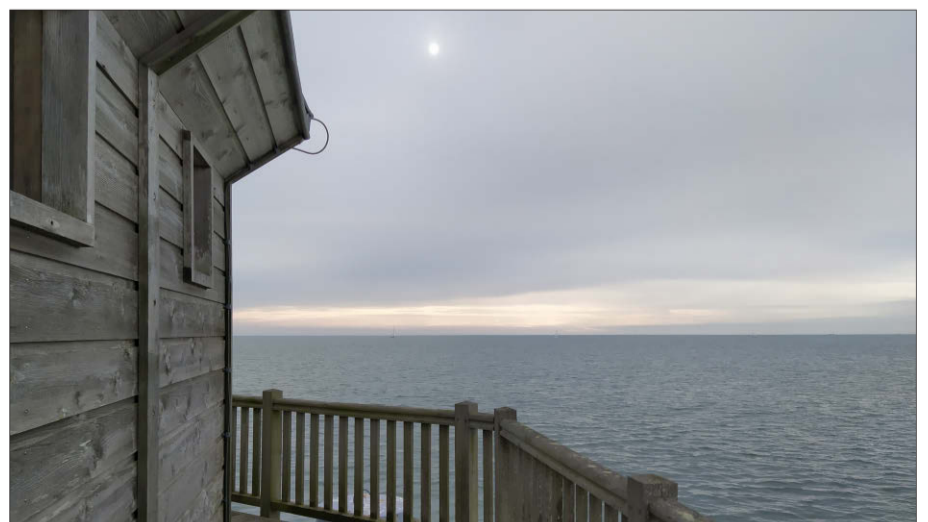
Une mer calme. Pas de vent. Un halo de soleil. Pas de sensations fortes au programme, mais une atmosphère propice au voyage de l'âme. Il n'en faut pas plus pour que son imaginaire vagabonde.