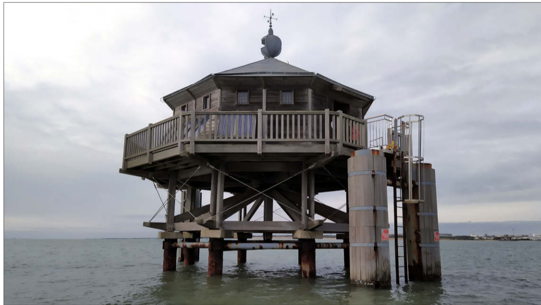
Le phare est fonctionnel. Son faisceau émet à 27 kilomètres. C'est le 150 e et dernier phare répertorié par le service des phares et balises.

Mon expérience, elle, a débuté le dimanche 27 octobre à 14h30 pour s'achever le lendemain à la même heure. Un jour de grande marée. Sans vent. L'arrivée sur les lieux s'effectue donc en zodiac à marée haute. Sinon, c'était à pied à marée basse. Bof.