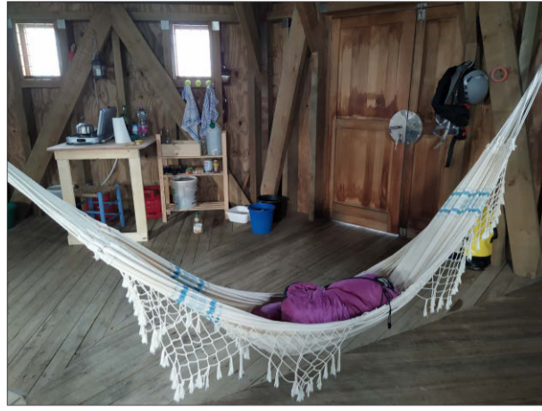
L'intérieur du phare a été aménagé de façon à offrir un confort sommaire, mais un confort quand même, aux gardiens qui vont se succéder.